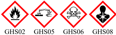
GHS02 GHS05 GHS06 GHS08